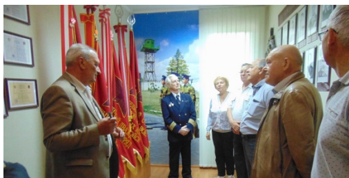
«Новые горизонты» (ноябрь). Выездное заседание.