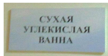
А вот и сухая углекислотная ванна. Это вообще что-то необычное.