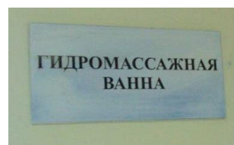
А это гидромассажная ванна, очень интересное лечение. Новое.