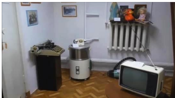
Советская печатная машинка, стиральная машина "Рига-17", телевизор.