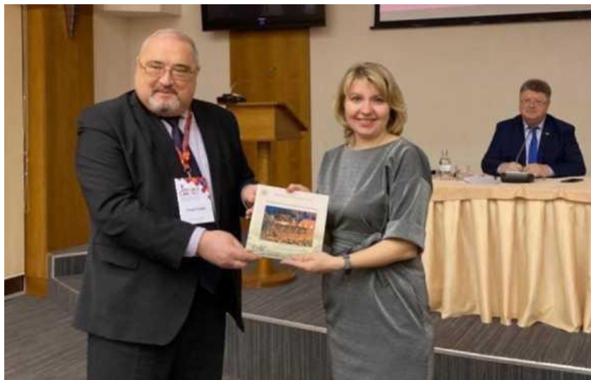
Подарок от библиотеки