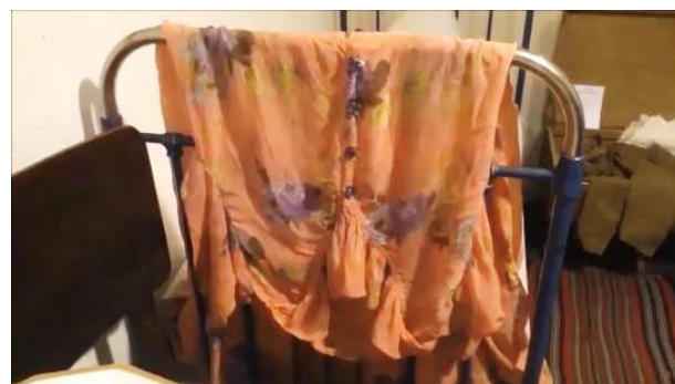
Женское платье послевоенных лет