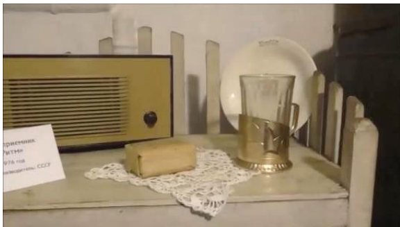
Приёмник, мыло, подстаканник со стаканом