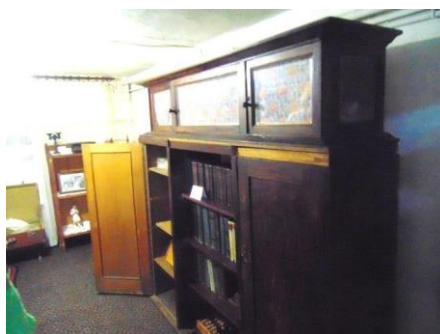
Это немецкий буфет 1920-х годов