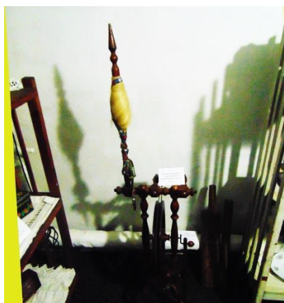
печатала на ней пьесы для драмтеатра.