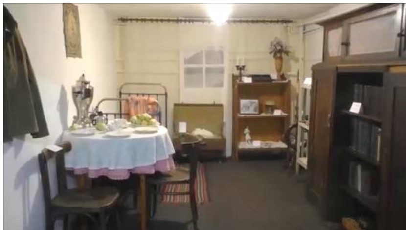
Комната с экспонатами послевоенного быта