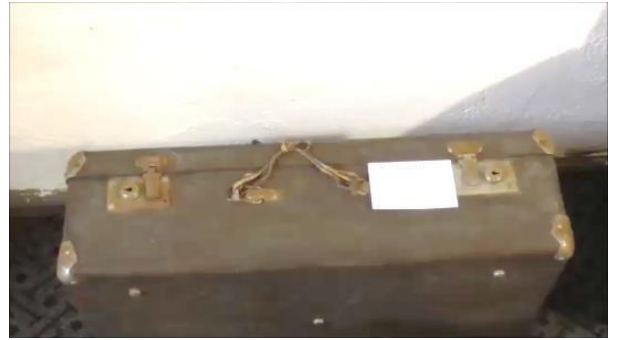
Чемодан послевоенных лет