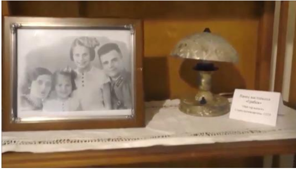
Семейная фотография и настольная лампа