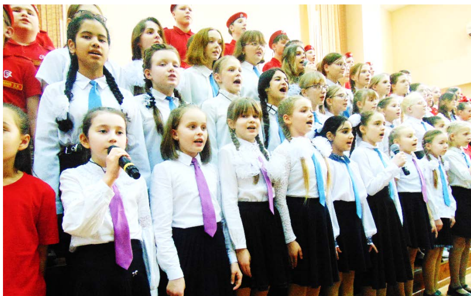
В завершении 6Ю класс в очередной раз доказал, что каждый из нас «внук того солдата».