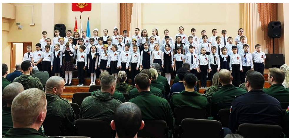
Юнармейский хор и все участники концерта свою последнюю композицию посвятили «Защитникам Отечества»- военнослужащим, ветеранам и всем, кто защищал и продолжает защищать и отстаивать целостность нашей страны.