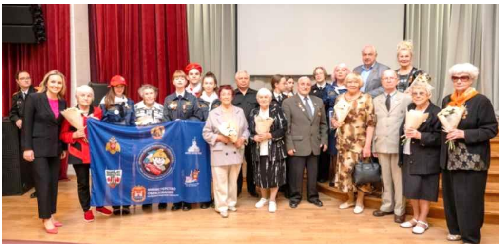
Ветераны и молодёжь