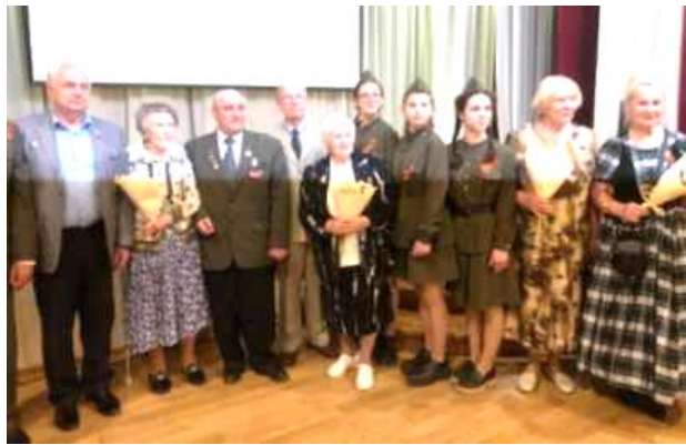
Ветераны и молодёжь