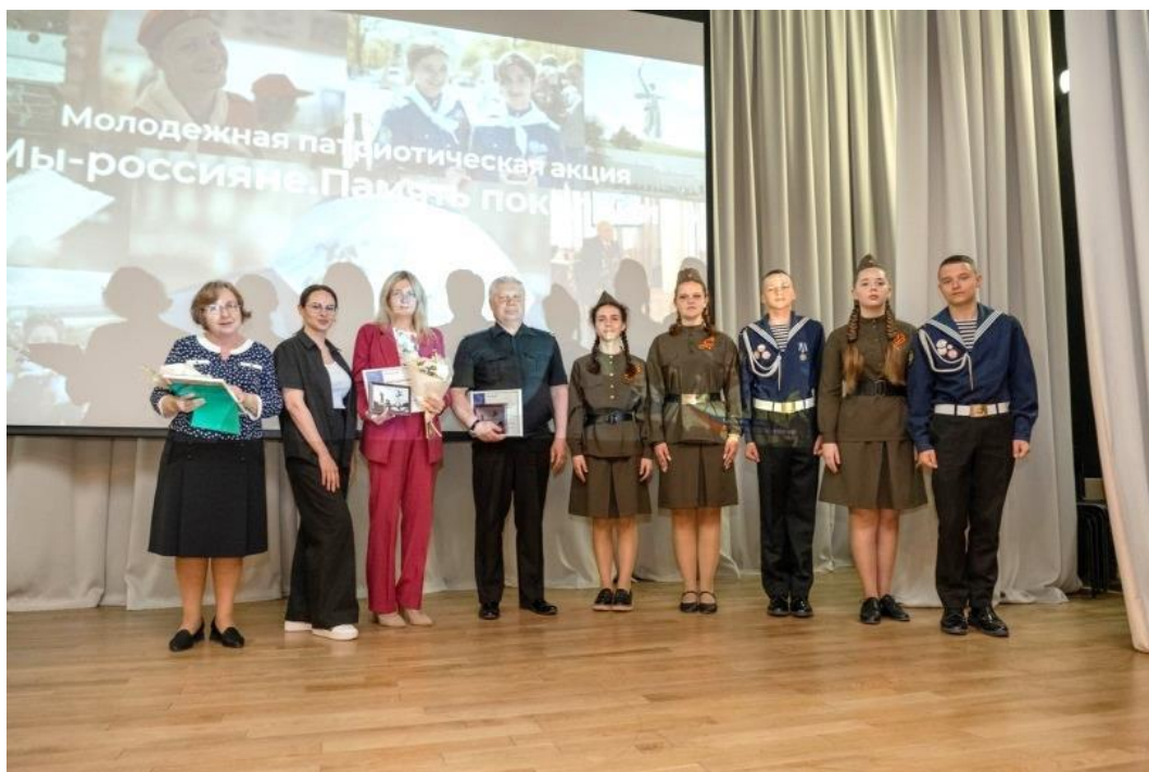
Фото награжденных одной из групп