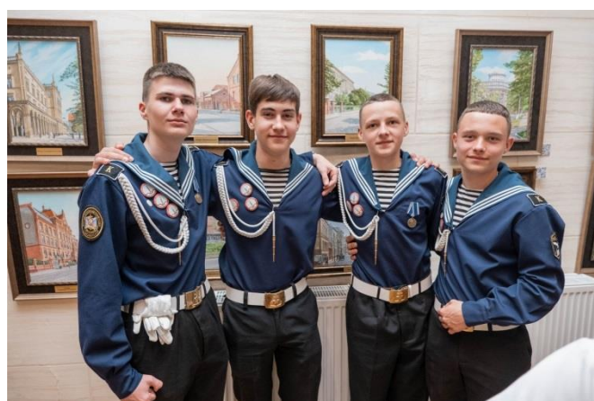
Ветераны и молодёжь