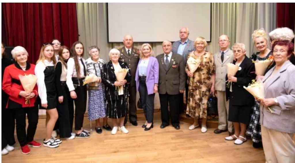
Ветераны и молодёжь