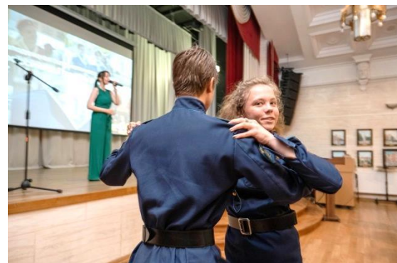
Во время поздравления ветеранов звучала песня