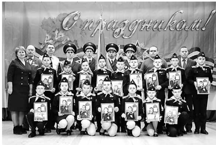
Встреча трех поколений – ветераны, военнослужащие, кадеты.

ников. Кадеты Новостроевской школы дали торжественное обещание и вступили в ряды ЮДП. С этим событием их тепло поздравили ветераны пограничной службы и дей-