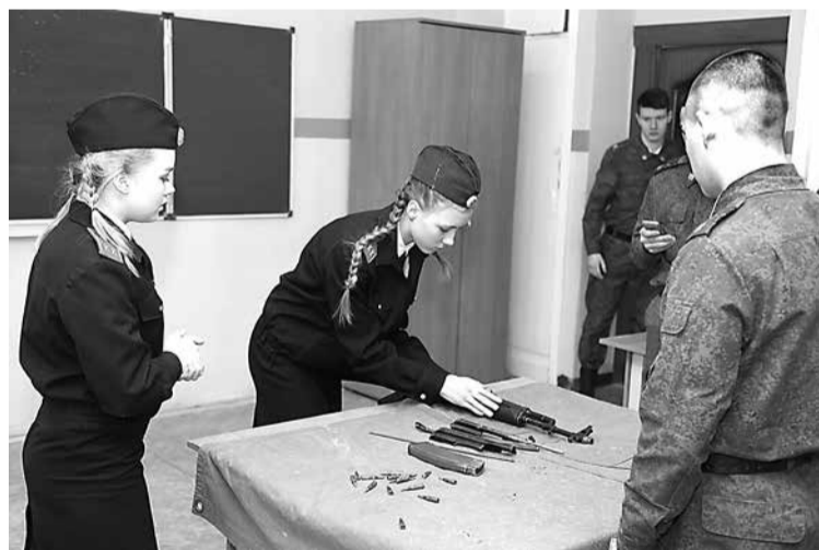
За порядком выполнения упражнения неполной разборки-сборки автомата АК-74 кадетами-девчушками, следили курсанты Калининградского пограничного института ФСБ России.

организации Мариинских соревнований, но чуть-чуть не додумал - не хватило опыта. А где же коллективный опыт всех кадетских классов школ города? Где работа по обобщению и анализу опыта работы кадетских классов работника-