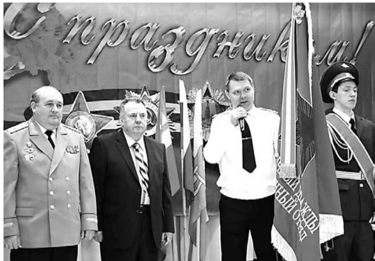
Церемония вручения дубликата Боевого Знамени 23-го пограничного дважды Краснознамённого отряда.

Недавно в Доме культуры пограничного города Нестерова прошли торжественные мероприятия, посвященные Дню образования 23-го пограничного дважды Краснознамённого отряда. Они были организованы и проведены сотрудниками Службы в г. Нестерове Пограничного управления ФСБ России по Калининградской области, являющейся преемницей славных традиций отряда, почётными пограничниками которого являлись В. И. Ленин, И. В. Сталин, А. М. Горький, И. Д. Папанин.