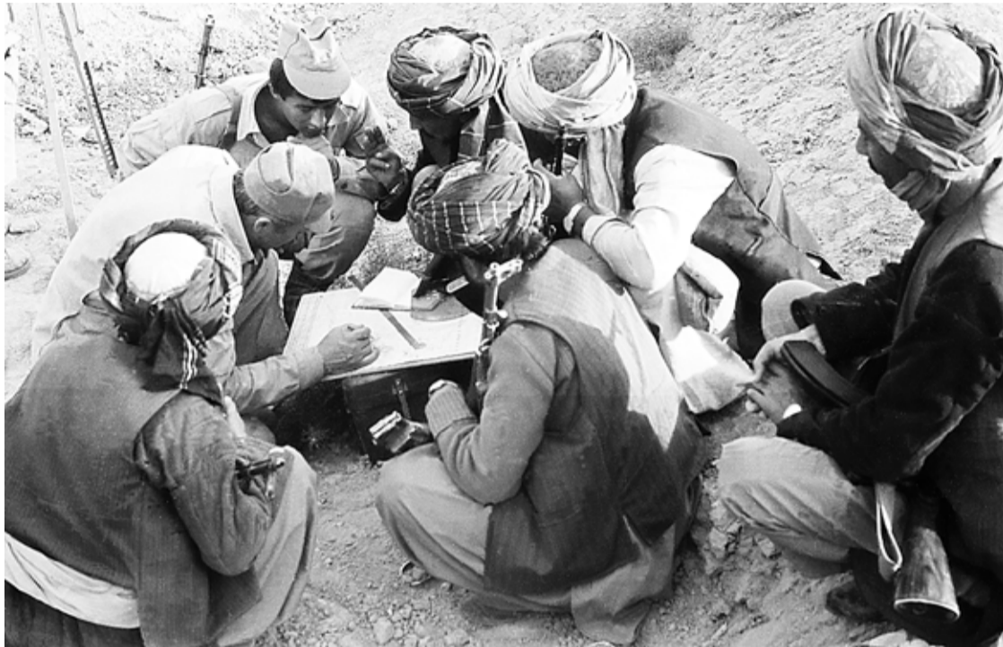
Подготовка к рейду на территорию врага проходила в сжатые сроки, при этом основное внимание уделялось разведке противника, отработке тактических приемов, подготовке вооружения и экипировке.

На душе у него весело. С серого неба роем сыплются снежинки. Он пытается поймать их розовым языком, чтобы попробовать на вкус. Снег - это хорошо. Значит, прилетят серые самолеты с черными крестами и не станут сбрасывать бомбы. А дедушка Саша не крикнет громким голосом: «Всем - в укрытие!» и не побегит во двор собирать свой отряд, который во время бомбежки всегда с баграми дежурит на крыше. Упадет сверху