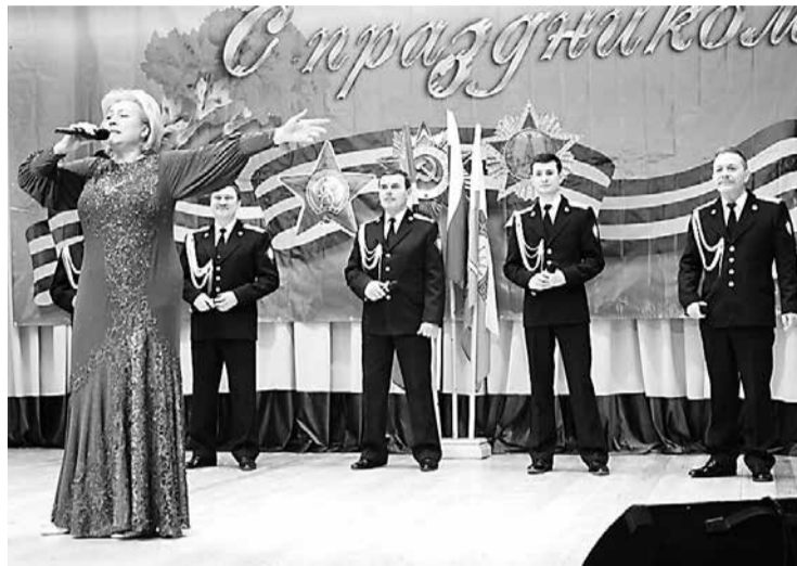
На сцене Дома культуры - солисты ансамбля песни и пляски «Пограничник Балтики».

Еще одним важным событием уже для подрастающего поколения стало создание отряда юных друзей погранич-