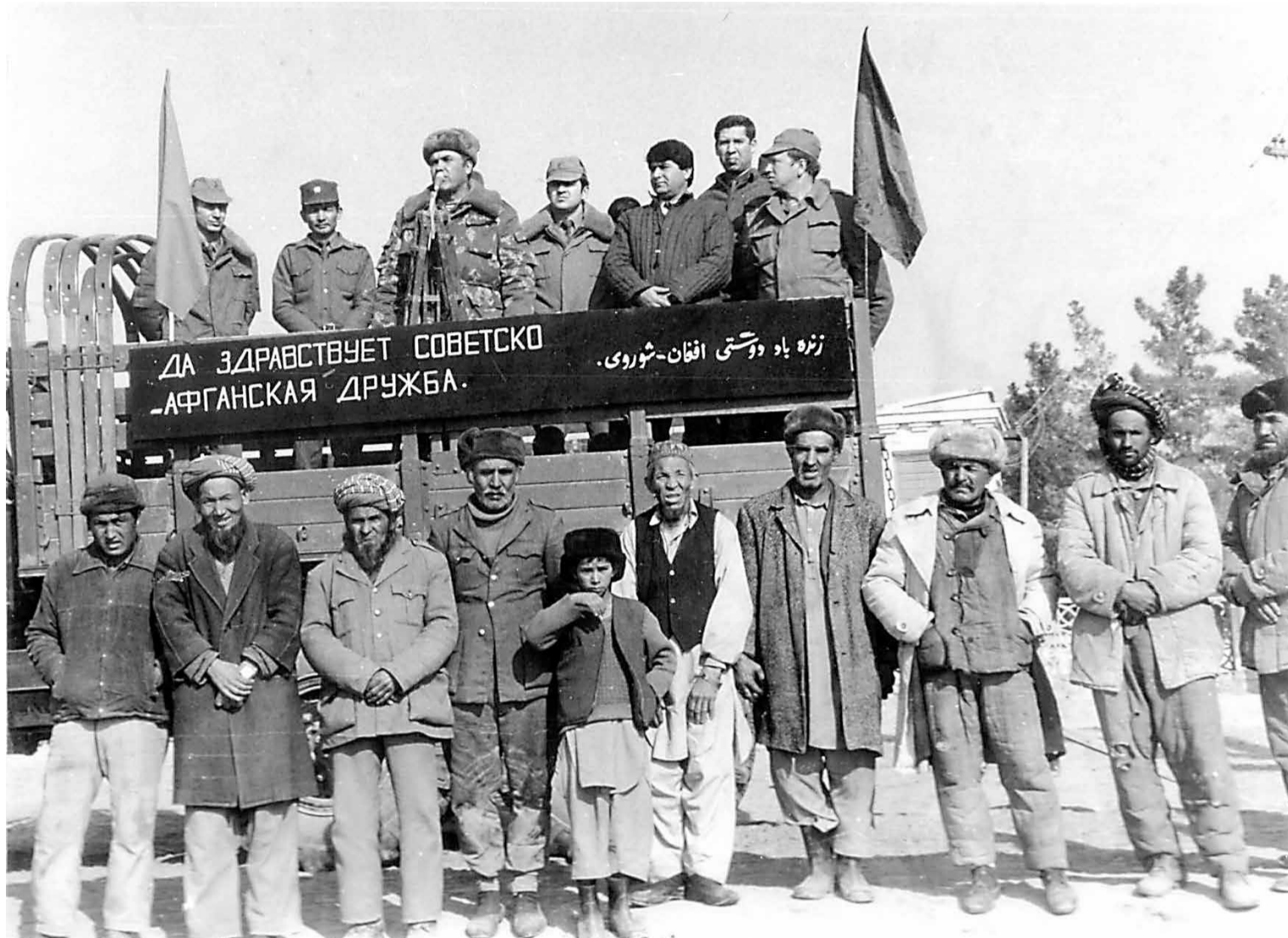
15 февраля 1989 года. На торжественном митинге по случаю вывода пограничных подразделений Пянджского ПОГО руководство ОГ «Душанбе» и начальник УМГБ Кундузской провинции Афганистана.

и уйти в Иран. Однако быстрые действия пограничников не оставили ему никакой возможности реализовать свой план. Агенту, не успевшему оказать сопротивление, пришлось безропотно сдать советским пограничникам. Нарядом, который задержал китайца, командовал старшина А. Бехало. Задержанный после разбирательства был передан в органы КГБ.