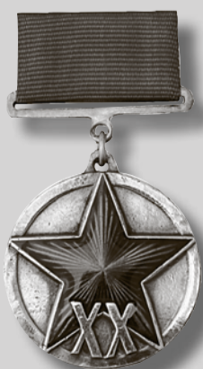
1938 г. Юбилейная медаль «XX лет Рабоче-Крестьянской Красной Армии».