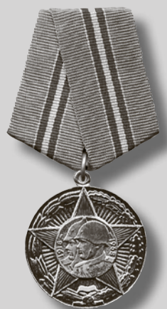
1967 г. Юбилейная медаль «50 лет Вооруженных Сил СССР».