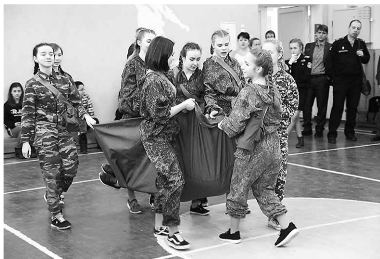
В ходе военизированной эстафеты кадеты демонстрировали умение оказывать первую помощь и переносить «раненого».