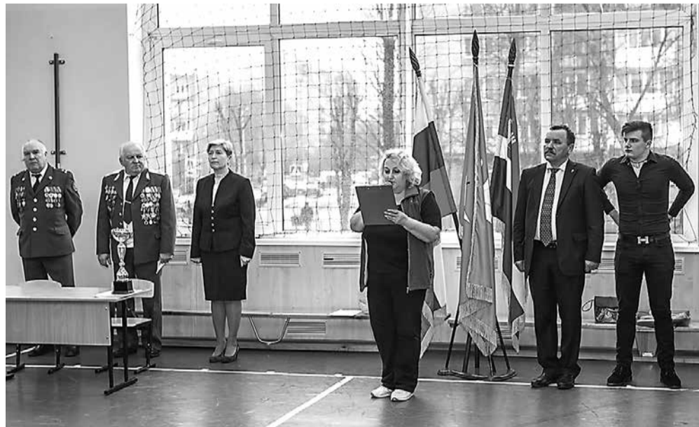
Февраль 2016 года, Калининград. Проведение конкурса «А ну-ка, парни!» в средней общеобразовательной школе № 31.

Для более эффективной охраны границы, которая включала в себя комплекс мер политического, экономического, военно-технического и правового характера, оперативники стали налаживать тесное взаимодействие с региональными и районными органами власти, территориальными структурами органов безопасности и МВД России. Со временем установившиеся связи и разработанные схемы взаимодействия, а также разъяснительная работа, которую вели пограничники в населенных пунктах приграничья дали свой