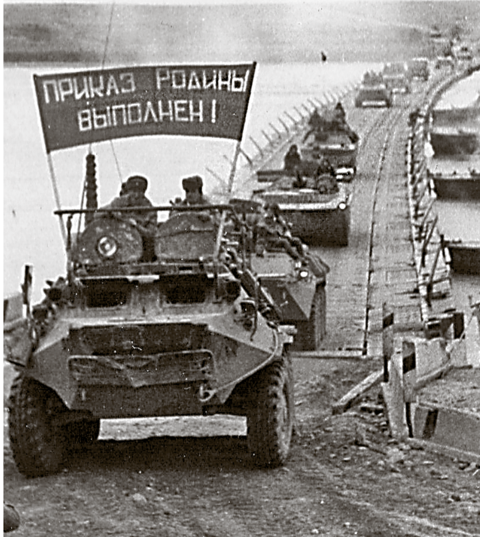
Выход последней колонны Пянджского пограничного отряда из ДРА по паромной переправе в районе пункта пропуска «Нижний Пяндж».