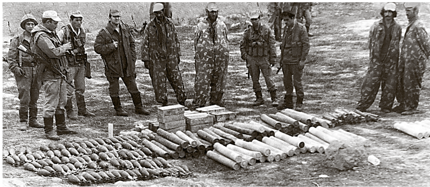
1987 год. Операция в Имам-Сахибской зоне Кундузской провинции Афганистана.

По результатам этой поездки разведотделы пограничных отрядов афганского