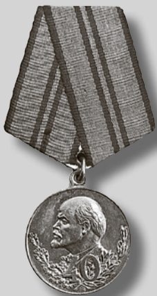
1957 г. Юбилейная медаль «40 лет Вооруженных Сил СССР».