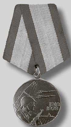
1978 г. Юбилейная медаль «60 лет Вооруженных Сил СССР».

вывод советских военных подразделений с территории ДРА, предотвратив потерю личного состава.