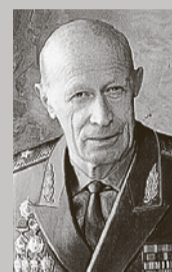
Из книги генерал-майор Ю. Дроздова «Вымысел исключен. Записки начальника нелегальной разведки»: «Впервые с афганской проблемой мне

Наряду с объектом «Дуб» (дворец Тадж-Бек) в этот день, 27 декабря 1979 года, были нейтрализованы еще 18 объек-