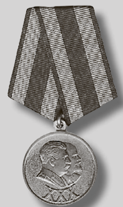
1948 г. Юбилейная медаль «30 лет Советской Армии и Флота».