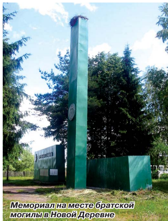
Мемориал на месте братской могилы в Новой Деревне

Военком, батальонный комиссар. 4 июня 1942 г.»