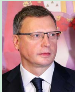
А.Л. БУРКОВ, временно исполняющий обязанности губернатора Омской области

Доброго вам здоровья и благополучия! Мира и добра вашему дому!