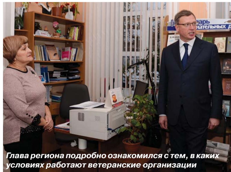
Глава региона подробно ознакомился с тем, в каких условиях работают ветеранские организации

Завершая встречу, врио губернатора Александр Бурков сообщил, что намерен вернуться к недавно подписанному соглашению между правительством Омской области и ветеранскими организациями, чтобы сделать его действительно рабочим документом и планом действий, направленным на поддержку старшего поколения.