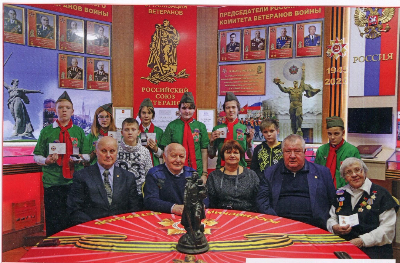
В музее Российского Союза ветеранов